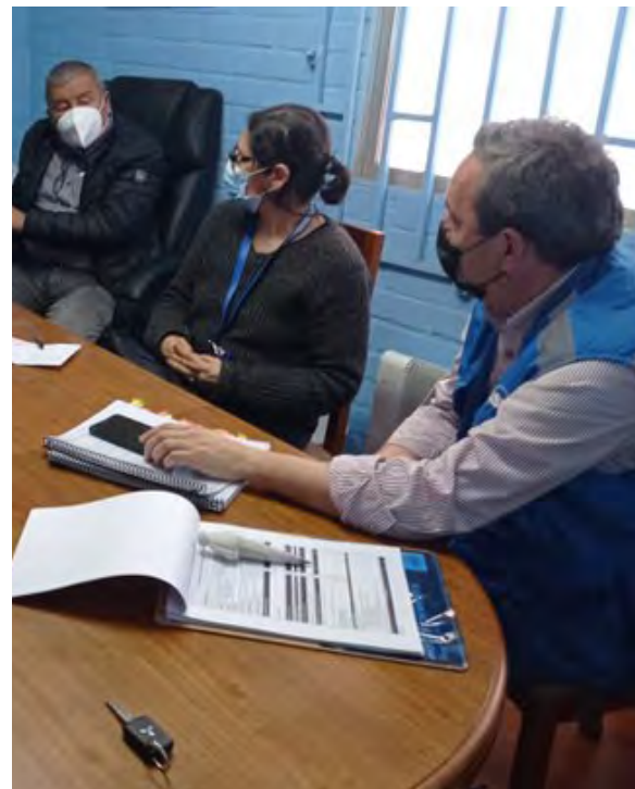
Cuadro N° 2